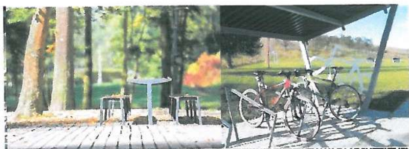
NOWOPROJEKTOWANE ELEMENTY MALEJ ARCHITEKTURY